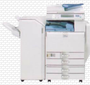
フィニッシャー装着時