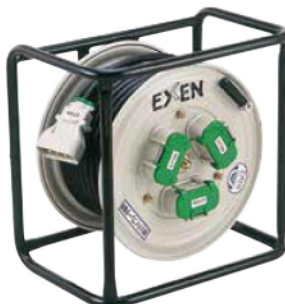
コードリール (取出し3口)