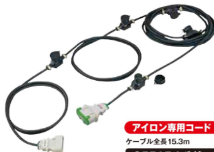
アイロン専用コード